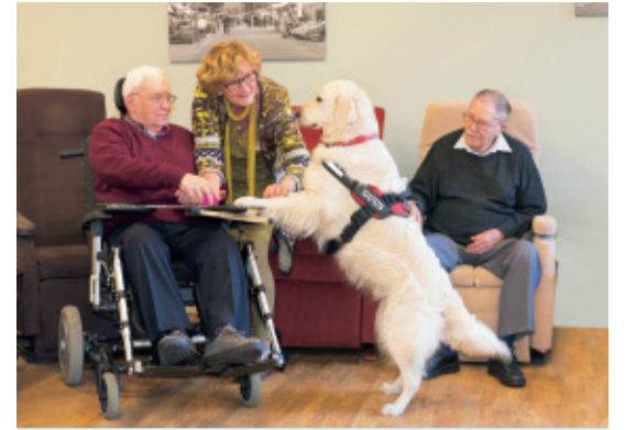
Een contacthond op de dagbehandeling

"Alle activiteiten doen we met een doel."